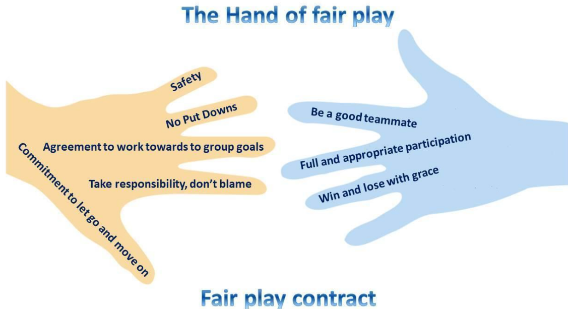
Εικόνα 2. Τίμιο Παιχνίδι

μαθητές/τριες καλοί συμπαίκτες/τριες, πώς να είναι πλήρως αφοσιωμένοι στο παιχνίδι και να συμμετέχουν σ' αυτό, πώς να κερδίζουν και να χάνουν με ευπρέπεια κ.λπ.) (Εικόνα 2).